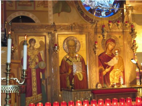
† Message from Father Kostandin